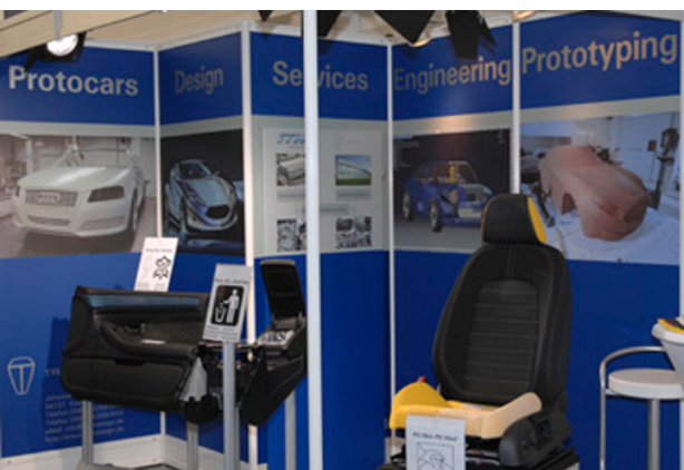
Messestand in Halle 6 auf der IZB 2010

Die internationale Zulieferer Börse (IZB) hat sich von einer Hausmesse der Volkswagen AG im Jahr 2001 zu einer hochwertigen Messe mit Top Ausstellern und einer großen Zahl an Entscheidungsträgern unter den Fachbesuchern entwickelt. Grund genug für Mitinhaber Achim Reitze, auf der Messe vom 6. - 8. Oktober 2010 die aktuellen Möglichkeiten und Leistungen zu präsentieren. „Es freut mich, daß es zu neuen Geschäftsverbindungen gekommen ist. Einige Besucher waren überrascht, welche Leistungen und Professionalität sich hinter dem Namen Trondesign verbirgt“, so Reitze.