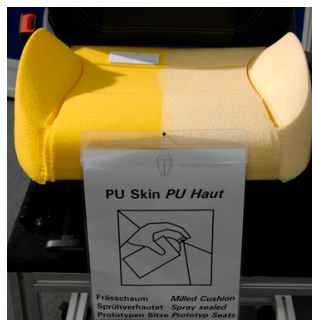
Schaum fräsrauh (l) verhautet (r)